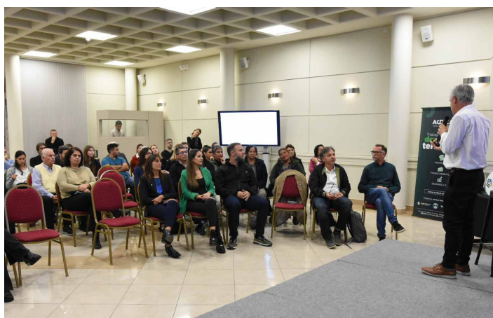
// Presentación de la edición 2023 del programa Instituciones Sustentables