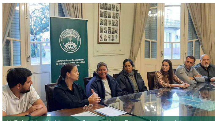
// Referentes de Marengo, Basso y Motor Parts en la firma del acuerdo con los Recicladores Urbanos