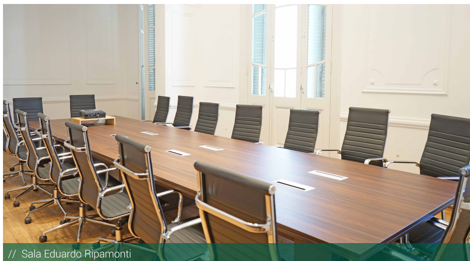
// Sala Eduardo Ripamonti