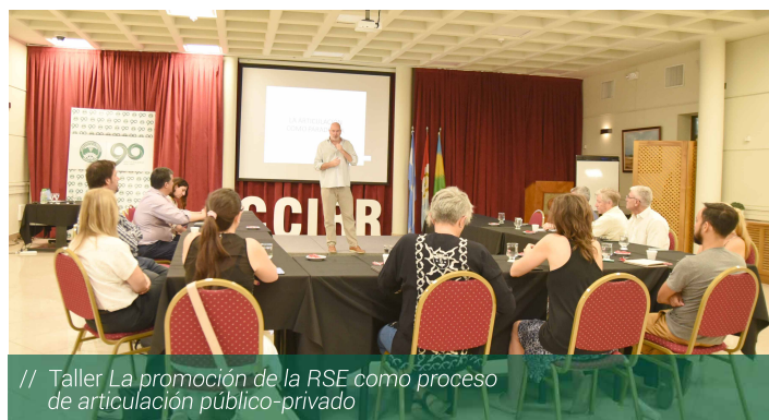
// Taller La promoción de la RSE como proceso de articulación público-privado