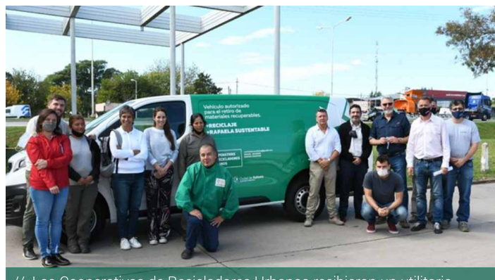
// Las Cooperativas de Recicladores Urbanos recibieron un utilitario para realizar sus tareas en el Área Industrial