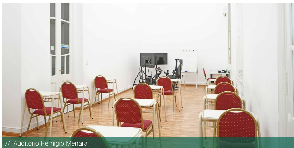
// Auditorio Remigio Menara