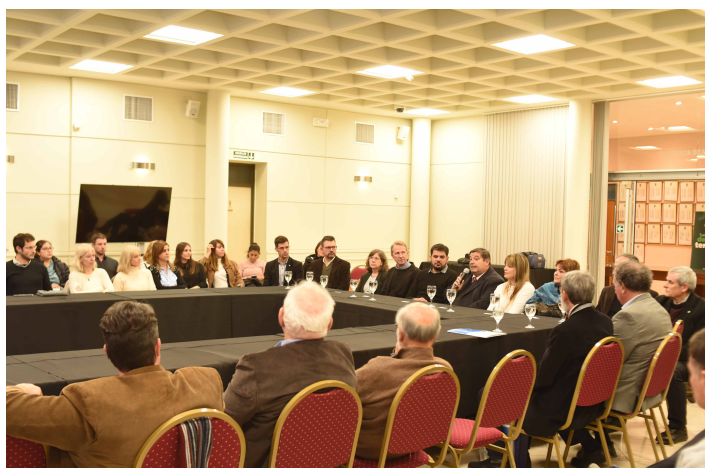
// Jornada Producción de alimentos y sostenibilidad ambiental: ¿podemos sumar sin restar?