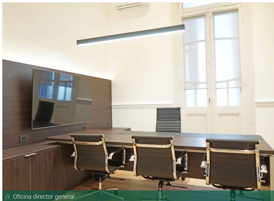
// Oficina director general

Finalmente, y respecto al cuidado del ambiente, continuamos realizando la separación de residuos (húmedos y secos) y fomentando el uso racional del agua y el papel. En este último caso, disponemos de urnas especiales para la recolección de los papeles que se descartan, los cuales luego son retirados en el marco del programa Instituciones Sustentables.