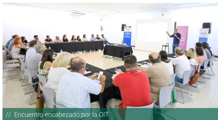
// Encuentro encabezado por la OIT