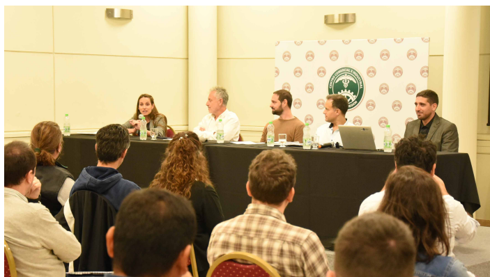
// Programas provinciales para la implementación de energías renovables