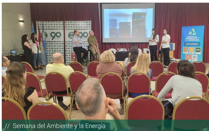
// Semana del Ambiente y la Energía

Entre otras cuestiones, Osan invitó a los presentes a pensar en cómo construir un modelo circular, que contemple aspectos como procesos productivos sustentables, comercio justo, consumo consciente, derechos laborales y sociales, basura cero, equilibrio sostenible, defensa de los bosques, energías renovables,