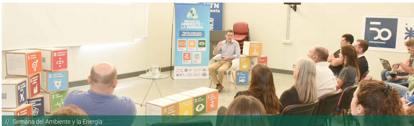
// Semana del Ambiente y la Energía

Para la tercera jornada, el ODS elegido fue el número 13, Acción por el clima.