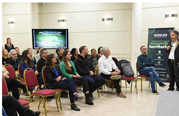
// Charla Negocios, creación de valor social y ambiental e impacto público

Cooperativas de Recicladores Urbanos y el sector privado.