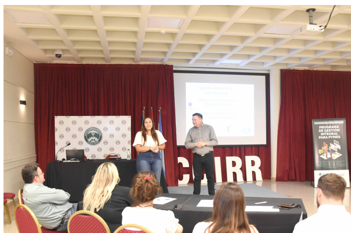
// Curso FONDEP Gestión ambiental y eco innovación