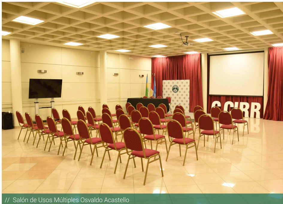
// Salón de Usos Múltiples Osvaldo Acastello

Paralelamente, trabajamos de forma permanente en el mantenimiento y mejoramiento de los