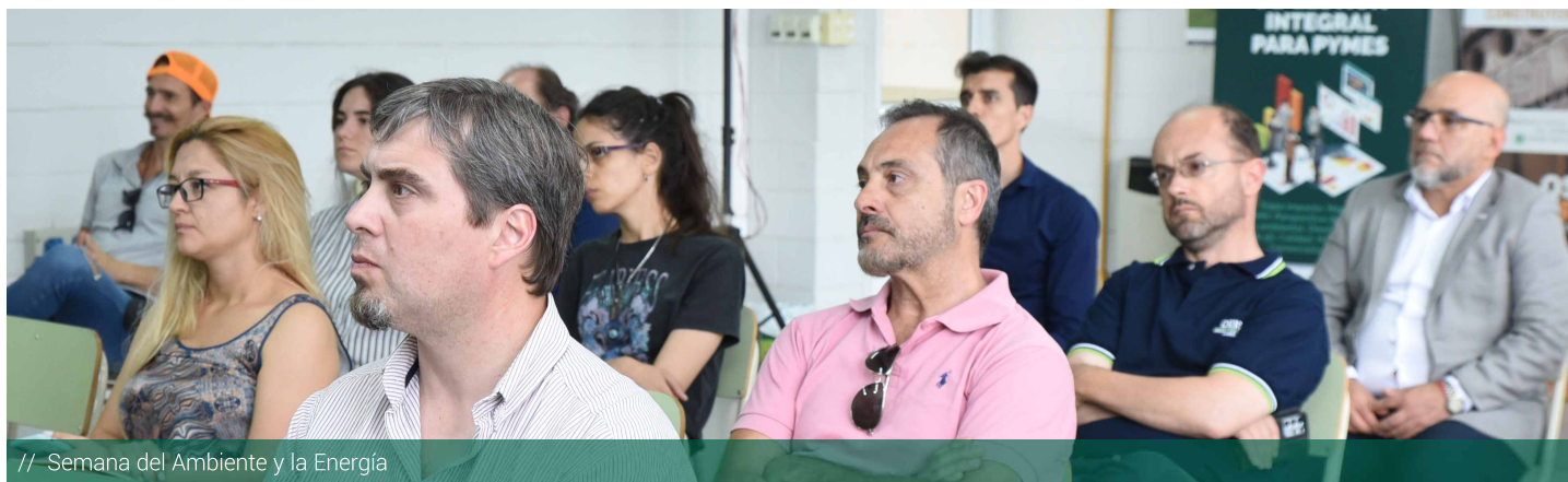
// Semana del Ambiente y la Energía