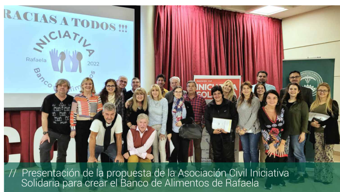
// Presentación de la propuesta de la Asociación Civil Iniciativa Solidaria para crear el Banco de Alimentos de Rafaela