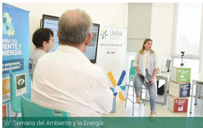
// Semana del Ambiente y la Energía