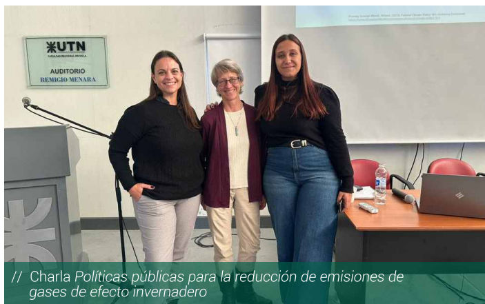
// Charla Políticas públicas para la reducción de emisiones de gases de efecto invernadero