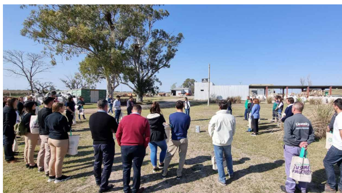
// Visita al Complejo Ambiental del IDSR

Paralelamente a lo narrado, en el transcurso de estos dos años, continuamos apoyando el programa Instituciones Sustentables, una iniciativa del IDSR y la Secretaría de Producción, Empleo e Innovación de la Municipalidad de Rafaela; que se materializa a través de un trabajo de articulación entre el Estado local, las