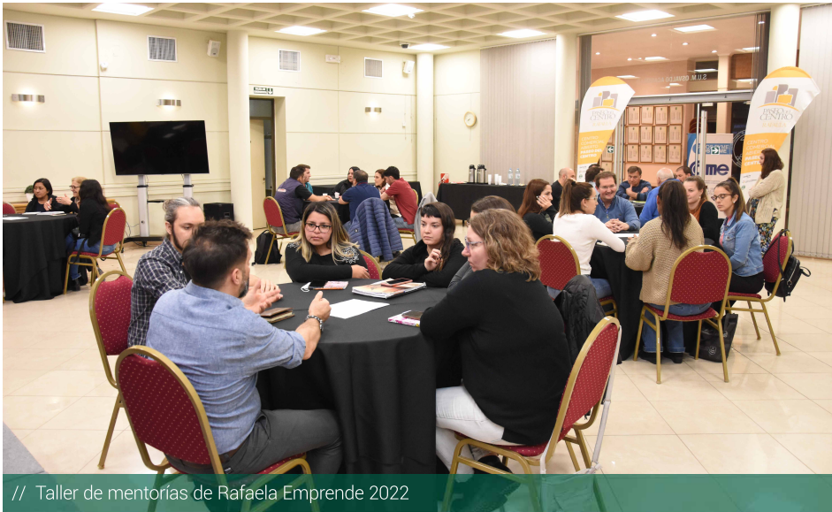
// Taller de mentorías de Rafaela Emprende 2022